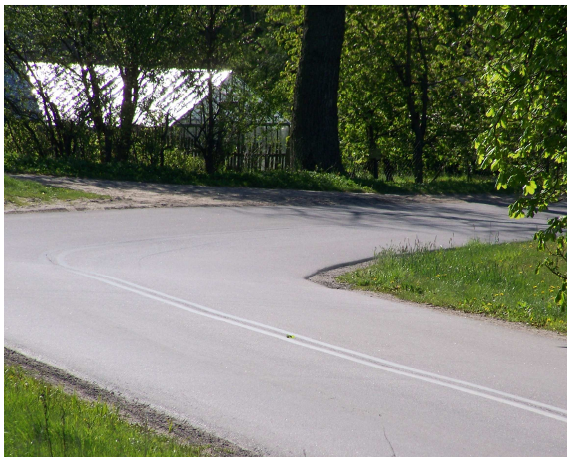
Zdjęcie 3. Droga powiatowa 1405G po remoncie.