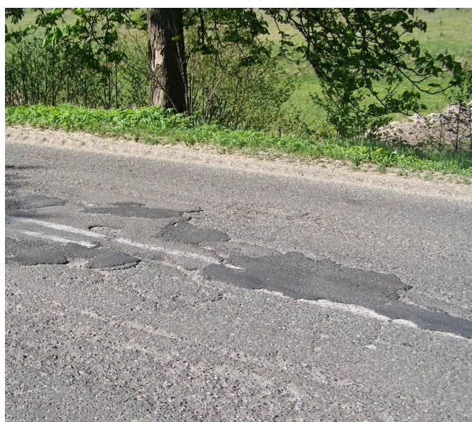
Zdjęcie 1. Droga powiatowa 1405G przed remontem.

Droga była w bardzo złym stanie, a jazda transportem kołowym utrudniona i niebezpieczna. Kręta, wyboista droga, z obu stron obsadzona drzewami, utrudnia poruszanie się pojazdami i stwarza zagrożenie bezpieczeństwa ruchu drogowego, a w szczególności niechronionych użytkowników ruchu: pieszych i rowerzystów.