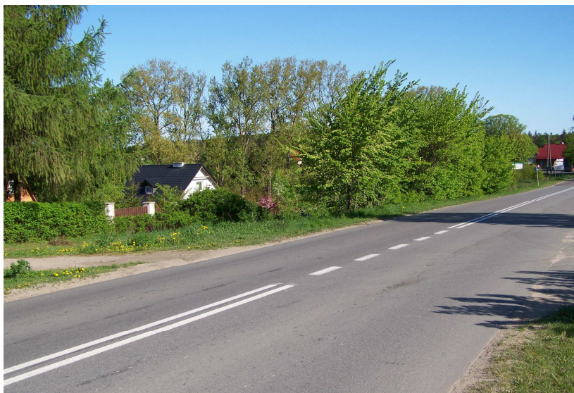
Zdjęcie 2. Droga powiatowa 1405G po remoncie.